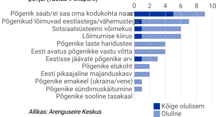
Joonis 1. Lõimumist mõjutavad tegurid Eestis ekspertküsitluse põhjal (vastas 9 eksperti)

Sõjapõgenike edukas lõimumine ühiskonda on kahepoolne protsess ja sõltub riiki saabujate kultuurilisest ning majanduslikust taustast, motivatsioonist kohanduda ja ka ühiskonna võimest võtta vastu uusi elanikke. Rahvusvaheline kogemus näitab, et väga tähtis on tööle asumise kiirus. Lõimumise edu määrab ka riiki saabumise eesmärk – töörändajad lõimuvad kiiremini, samas kui läbirändajate motivatsioon lõimuda on madal. Lõimumist toetab põgenike