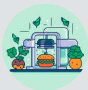
альтернативное производство мяса

По оценке экспертов, наибольшее возможное влияние на Эстонию могут оказать следующие находящиеся на этапе развития технологии: